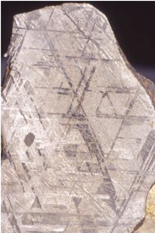
Aus Meteoreisen schmiedet man noch heute magische Waffen gegen Geister und Dämonen. Es ist eines der besten Mittel zur Erhöhung der Widerstandskraft gegen Infektionen.

"Eisen ist nicht nur - im Gegensatz zu den meisten Schwermetallen - ein ungiftiges Metall, sondern es ist darüber hinaus mit der Eigenschaft begabt, die Wirksamkeit schwerer mineralischer Gifte aufzuheben" (Pelikan). Gäbe es diese Kraft nicht, wäre sämtliches Wasser und jede Nahrung durch gelöste Gifte wie Arsen oder Quecksilber, toxisch. Dies bedeutet, dass bei zahlreichen schwächenden Krankheiten, die auf Vergiftungen beruhen, beispielsweise Anämie durch Bleivergiftung, Eisen als Heilmittel notwendig ist.