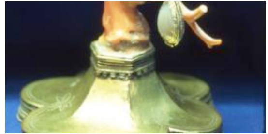
Im Sympathiezauber gilt die eisenhaltige Rote Koralle als besonders wirksamer Schutz gegen Krankheitsdämonen und Wahnsinn.

Würde man Eisen zum Graben verwenden, dann würde man die magische Kraft der Elementarwesen bannen. Eine solche Pflanze hätte zwar noch eine gewisse Heilkraft, aber keine magische Macht, die sie nur durch ungebannte Elementarwesen erhält.