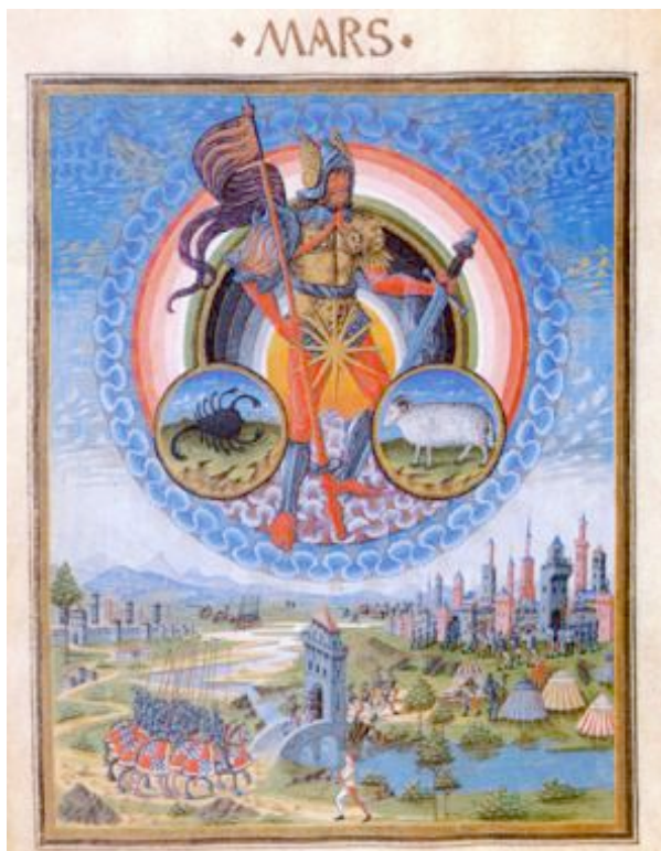
Klassische Darstellung des Mars in eiserner Rüstung. De Sphaera, 15. Jh.

Nicht zufällig regiert Mars das Sternbild Widder. Mars ist der Anfang, der Frühling, der Morgen, die Geburt von etwas Neuem, dessen Zukunft noch nicht feststeht. Er ist der Meister aller Möglichkeiten, er ist die Kraft der Eroberung, er ist die Sehnsucht, Grenzen zu sprengen, der Wille zur Freiheit und zur Macht. Mars ist der "Übergewaltige, Stolze, in Erz Gerüstete, (...) unermüdlich und handstark, Zwingherr widriger Mächte, König männlichen Mutes, Vater des glücklichen Sieges, Helfer der Menschen, Spender der Kraft und Verscheucher bitterer Feigheit" (Homerische Hymnen, zit. n. Selawry).