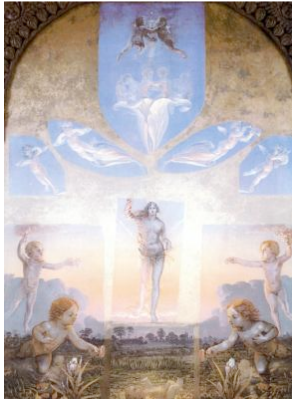
Mars verkörpert jeden Anfang, den Morgen, den Frühling und die Geburt. "Der große Morgen" von P.O. Runge, 1809

Besonders interessant ist die magnetische Kraft des Eisens, eine Eigenschaft, die das Marsmetall vor allen anderen Metallen auszeichnet. Magnetismus führt zur Polarisierung der Welt und ermöglicht nicht nur Zugvögeln eine räumliche Orientierung. Sämtliche Lebensprozesse ordnen sich durch Eisen polar an, folgen also dem Gesetz der räumlichen Ordnung. Vor allem aber führt der Magnetismus zur Durchdringung von Geist und Stoff. Diese