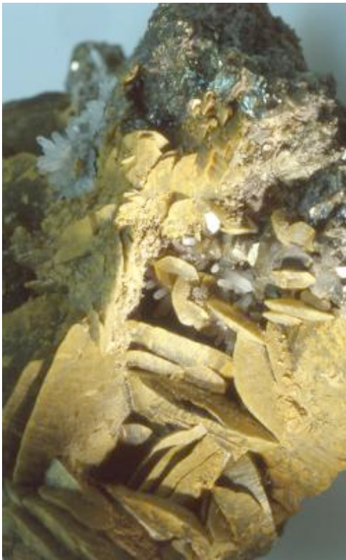
Siderit (Eisen-II-carbonat) ist ein bewährtes Mittel um die Sauerstoffbilanz zu verbessern.

Eisen finden wir im ganzen Körper (7). Seine Unentbehrlichkeit für jede Form organischen Lebens beruht auf seiner Mitwirkung in der Energiebildung durch den Zellstoffwechsel (Atmungskette). Die Atmung der Nervenzellen braucht Eisen in Form des Atemferments, des Zytochroms.